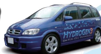
GM The Hydrogen 3