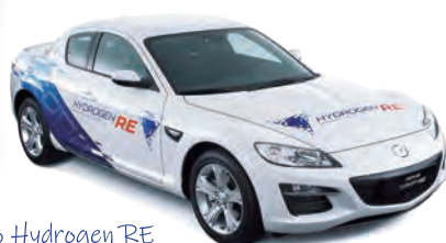
MAZDA RX8 Hydrogen RE