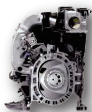
MAZDA Hydrogen rotary engine

現在の水素燃料の概要から、 製造と貯蔵・輸送・水素ステーションでの利用、 また、水素自動車開発の歴史をパネルと、 試作車からエンジン、市販車など、 さまざまな車両・パーツを展示し、ご紹介致します。