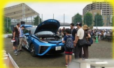
イベントや研修など