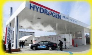
充填もご体験ください