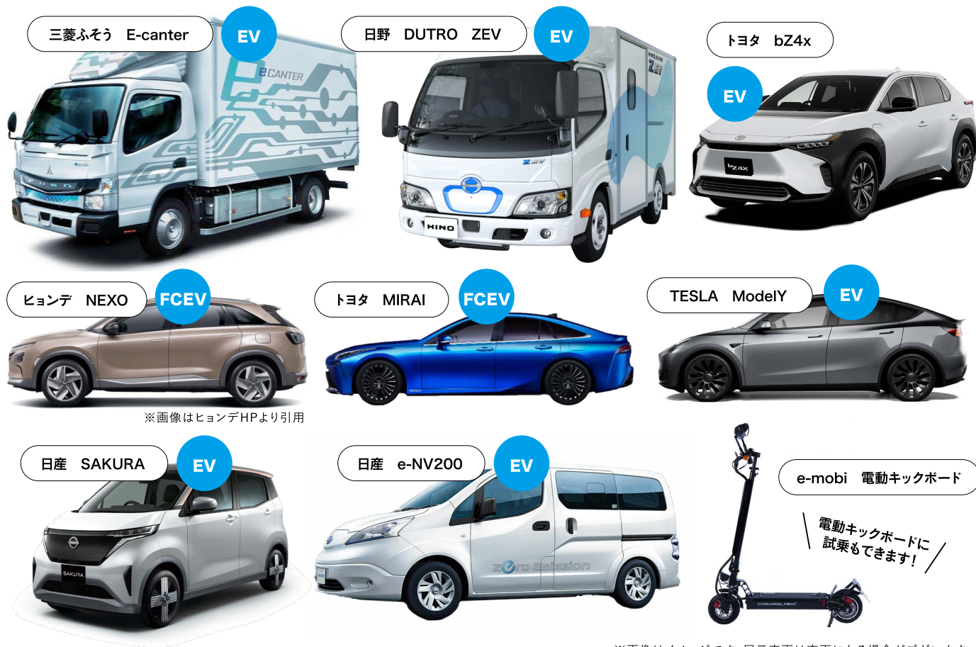
※画像はイメージです。展示車両は変更になる場合がございます。